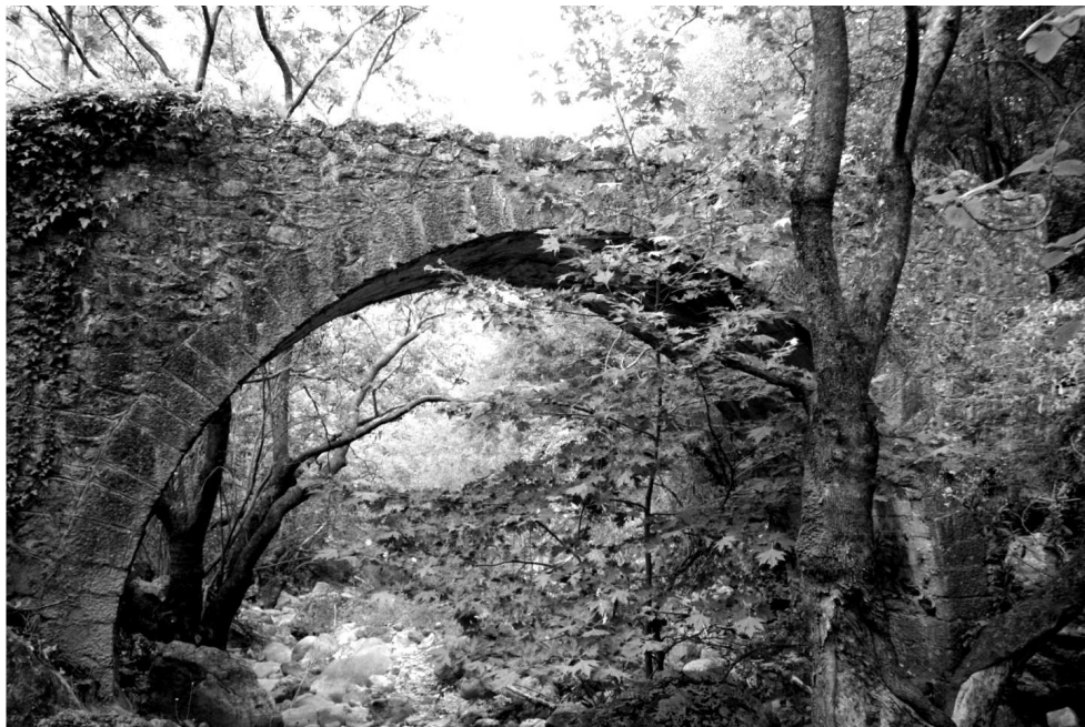
Το γεφύρι της Παναγιάς της Καταφυγιώτισσας

αγγίξει. Ίσως και να λυπήθηκε τη μεγάλη ομορφιά του ή πάλι ίσως και να μην το έχει δει εκεί κρυμμένο που είναι στη μαγευτική χαράδρα της Κάκαρης. Καθίσαμε λοιπόν ανέμελοι πάνω στο γεφύρι, αφήνοντας τον εαυτό μας ελεύθερο στη θέληση της ομορφιάς της φύσης. Αμέσως ξεχάσαμε τα πάντα, σκοτούρες, προβλήματα και ό,τι βάραινε τις παιδικές καρδιές μας. Κοιτάζαμε με δέος τον μεγαλοπρεπή βράχο της Παναγιάς μας και αναλογιστήκαμε τον θαυμαστό τρόπο με τον οποίο η Μητέρα μας θέλησε να κτίσει εκεί, στον απόκρημνο και απότομο βράχο το σπηλαιώδες μοναστήρι της.