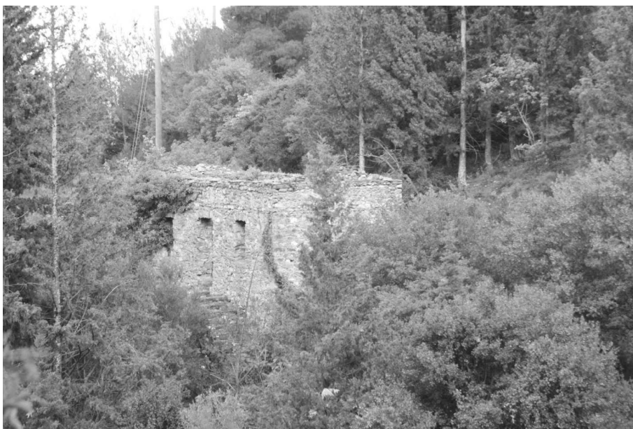
Ο μύλος του Κοτταρά

Έτσι, ένα απόγευμα, παρά τις μικρές ενστάσεις των γονιών μας, αποφασισμένοι πως θα μπορούσαμε ίσως και να φτάναμε μέχρι το μοναστήρι, μαζευτήκαμε μια παρέα κολλητών φίλων στο άλλο παλιό γεφύρι του χωριού ή αλλιώς του Κοτταρά (προφανώς πηρέ το όνομα του διότι πλησίον του βρίσκεται ο μύλος του Κοτταρά) στο δυτικό άκρο του χωριού. Αυτό το γεφύρι ενώνει το χωριό με το ξωκλήσι της Αγίας Τριάδος, το οποίο βρίσκεται λίγα μετρά πιο πάνω, κρυμμένο μέσα στα πεύκα και τις ελιές. Από εκεί άλλωστε αρχίζει το ανηφορικό μονοπάτι για το μοναστήρι.