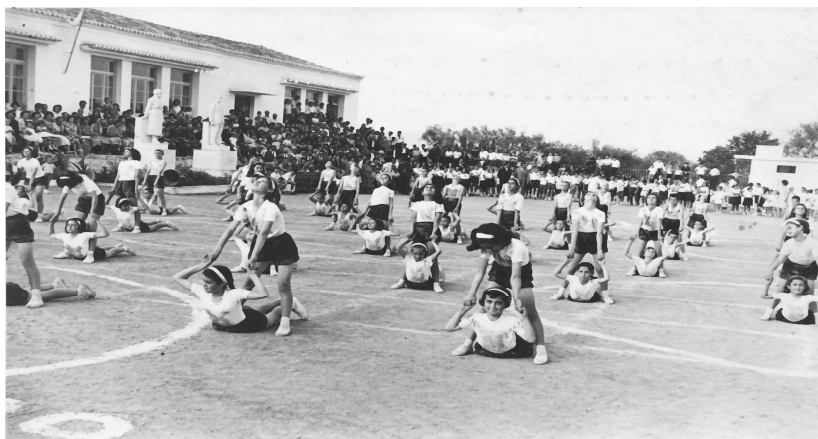
Μαθητές σε γυμναστικές επιδείξεις (1967 ή 1968)

Το «γεγονός» λοιπόν στο τέλος κάθε σχολικής χρονιάς ήταν οι εξετάσεις, που ήταν συνδυασμένες με τις γυμναστικές επιδείξεις στο προαύλιο του σχολείου, γεγονός που απαιτούσε αρκετές δοκιμαστικές πριν από την τελική, που γινόταν μπροστά σε όλους τους γονείς μας και τους υπόλοιπους συγχωριανούς μας. Ήταν επίσης απόδειξη της κοπιαστικής δουλειάς και των δασκάλων μας ενώπιον των γονέων μας αλλά και του επιθεωρητή της Πρωτοβάθμιας Εκπαίδευσης. Για μας ήταν χαρά γιατί θα φορούσαμε αθλητικά παπούτσια, τις γνωστές στους παλιούς ΕΛΒΙΕΛΕΣ (Ελληνική Βιοτεχνία Ελαστικών), κοντά παντελονάκια και αθλητικά φανελάκια. Υπήρχε ακόμα προετοιμασία για απαγγελία ποιημάτων, μικρών διαλόγων (σκετσάκια) και χορών. Την παραμονή της εκδήλωσης χαράζαμε τις γραμμές και τους κύκλους των χορών με ασβέστη. Το προαύλιο κλειδωνόταν για να μείνει άθικτο μέχρι την επόμενη μέρα.