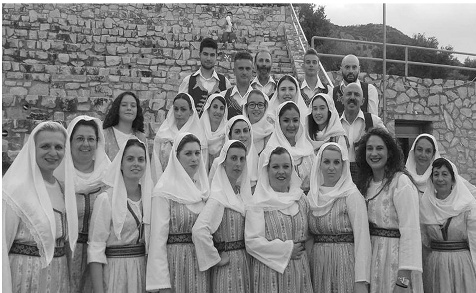
Το χορευτικό τμήμα του Πολιτιστικού Συλλόγου Ξηροκαμπίου