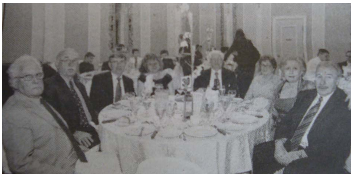
(Οι φωτογραφίες είναι από τις εφημερίδες: «Εβδομάδα» και «Ελληνικός Τύπος»)