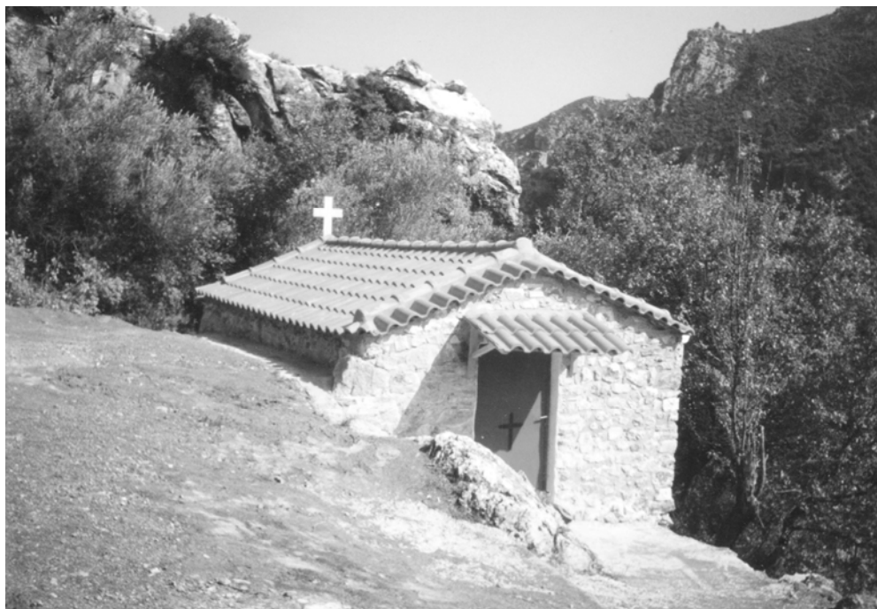
ΠΕΡΙΟΔΟΣ Δ' ΤΕΥΧΟΣ 58 ο ΙΟΥΛΙΟΣ 2013