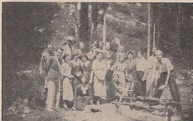
Οι φωτογραφίες είναι από την Πρωτομαγιά του 1940.